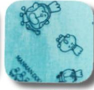
A-20 ミントグリーン×紺